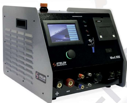
Mod. 906 Generatore 150 A (140 A @ 100%) Filo d'apporto a richiesta