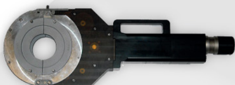
Mod. 312 Ø 65 - 115 mm